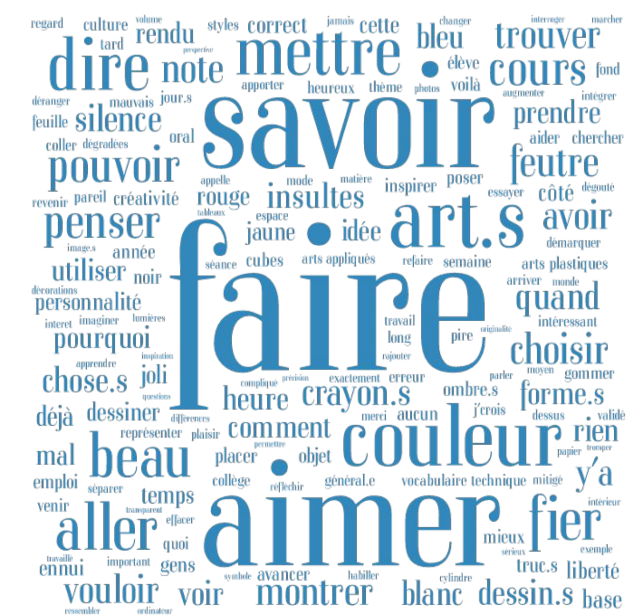
Lexicométrie des élèves lors de présentation orales (2016), en classe (2018, 2019) en entretiens (2017)

La méthode repose sur l'observation simple de séances au cours desquelles des scénarios sont isolés et expliqués, une lecture des postures de l'enseignant en est ensuite faite. Sous l'effet de diverses causes externes ou internes et pour des raisons, des intentions et des motivations variées, les configurations que ces postures prennent, constituent un volet de la question du développement de l'estime de soi de l'élève par l'enseignement des arts appliqués. Cependant l'observation de ces configurations ne suffit pas à traiter cette question et pour cette raison des entretiens avec des élèves sont également considérées afin d'affiner la dynamique réciproque des postures de l'élève et de l'enseignant.