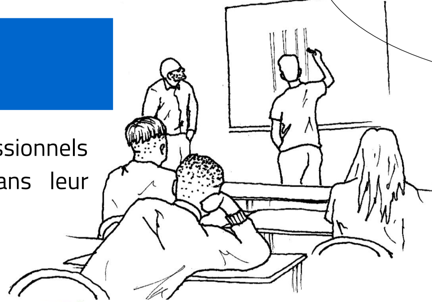
Les préoccupations de la matrice de l'activité de l'enseignant d'arts appliqués de LP.